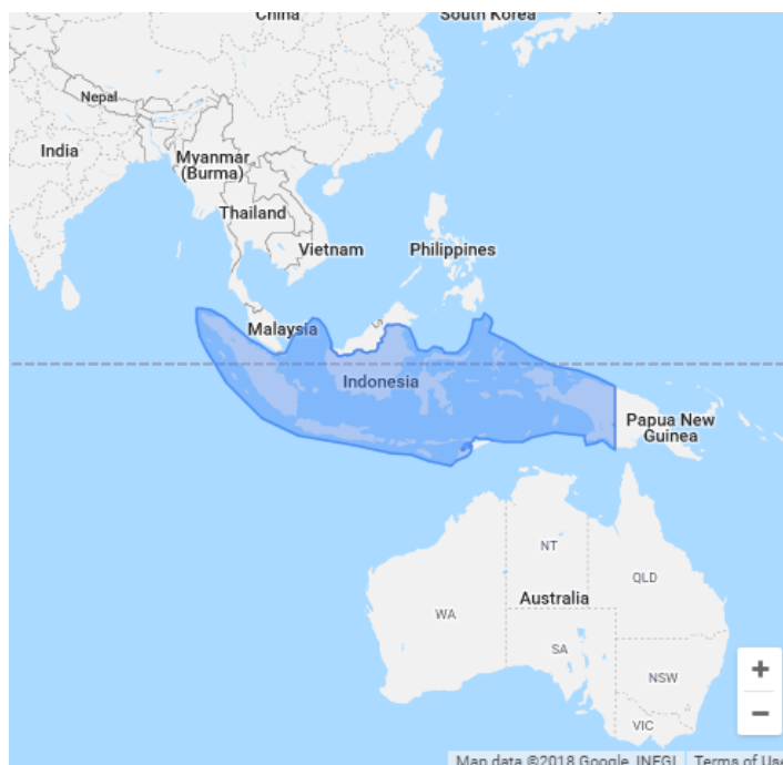
Gambar 1. Target kata Kunci wilayah Indonesia

memilih kata kunci yang tepat sesuai dengan area usaha, website UMKM memiliki potensi untuk dikunjungi oleh banyak pelanggan. Kunjungan yang banyak terhadap sebuah website UMKM, akan meningkatkan potensi penjualan. Dalam penelitian ini, diambil sampel sebuah UMKM yang memiliki usaha di bidang Makanan dan Minuman, yaitu Bandrek. Akan dicari kata kunci turunan yang tepat untuk kata kunci Utama Bandrek.